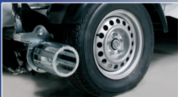
Système de direction facile d'utilisation – manoeuvres facilitées et sans effort.