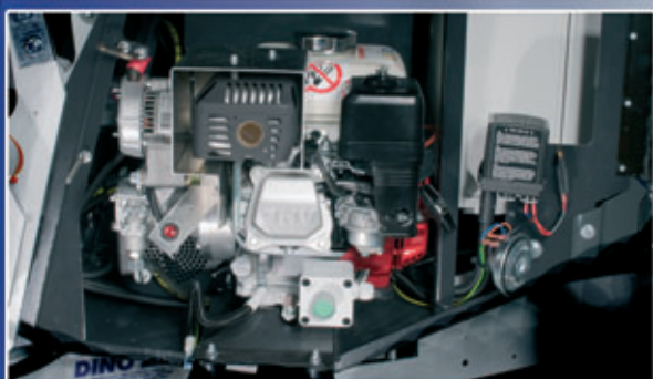
Bloc d'alimentation essence ou diesel – standard – fonctionne aussi sans branchement électrique.