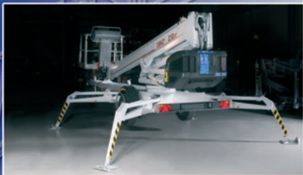
Stabilisateurs articulés de type "arignée" – garde au sol élevée avec des stabilisateurs compacts.